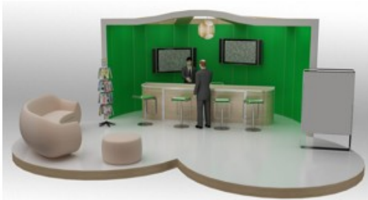
Stand Intermedio | 575 € iva incl.

El Stand Superior le permitirá insertar esta información promocional de su entidad, y sus productos o servicios en el stand contratado. El precio incluye i.v.a