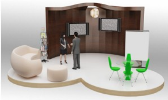
Stand Superior | 675 € iva incl.