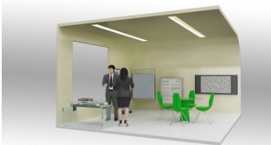
Stand Básico | 475 € iva incl.

El Stand Intermedio le permitirá insertar esta información promocional de su entidad, y sus productos o servicios en el stand contratado. El precio incluye i.v.a